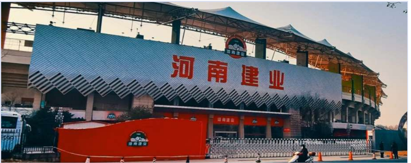
河南建业是香港证券交易所上市企业

11月中，河南省最大的房地产企业建业集团被曝出将进行大裁员，规模达7000人。公司员工表示一线销售人员、策划人员都被波及，项目公司的部分支持性岗位也遭遇了裁员。此外，也有消息称在岗员工也要降薪40%。今年房地产出现危机后，不仅是房屋购买者，现在大量一线从业者也遭遇困境。 阅读原文