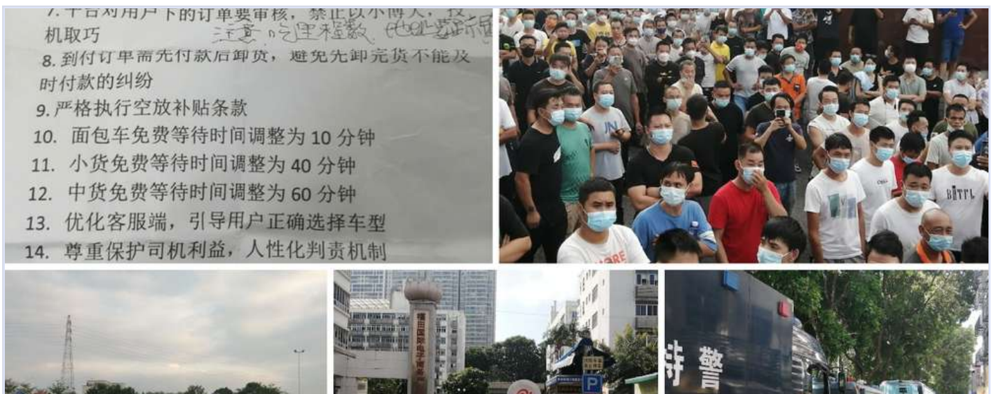
东莞货拉拉司机聚集抗议，提出多项诉求，特警也出动到场