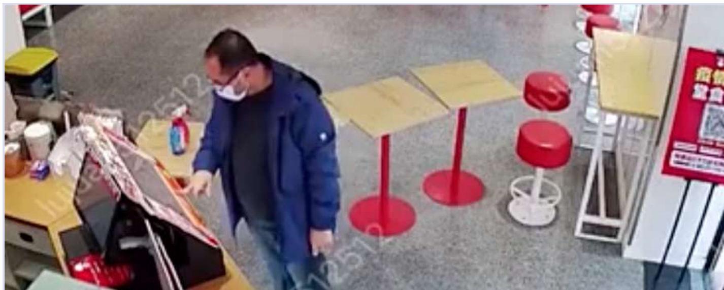
市场监管局工作人员假装顾客进入奶茶店

11月10日，黑龙江绥化一位市场监管局工作人员假装成顾客进入奶茶店。谁料，店员的一句普通的“欢迎光临”却被监管局人员认定为违规，因为没有第一句先说“扫码”。而该奶茶店也立即遭到贴封条关店的处罚。这种离谱做法引起线上线下的民众愤怒斥责。后续，该检查人员被当地政府记过、调离现职。 阅读原文