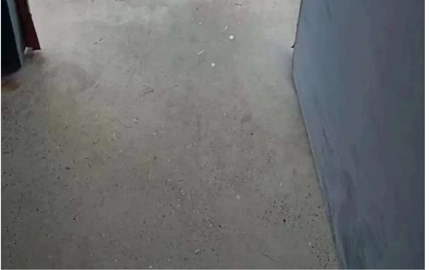
摆放整齐的皮鞋，挎包和手机，疑似跳楼阿姨的遗物

事发后，部分深圳大学学生声讨学校，并揭露了这名后勤员工的困境： 学校长期封校却未向后勤人员提供住宿，后勤人员只能在学校打地铺。学校大部分时间各处都有学生，只有等到学生都下晚自习了，他们才敢混进教学楼在角落睡上一晚。 日常，她都被迫在厕所晾晒衣物和洗澡洗头，被褥枕头也都是放在清扫工具间，条件非常艰困。 ( 来源 )