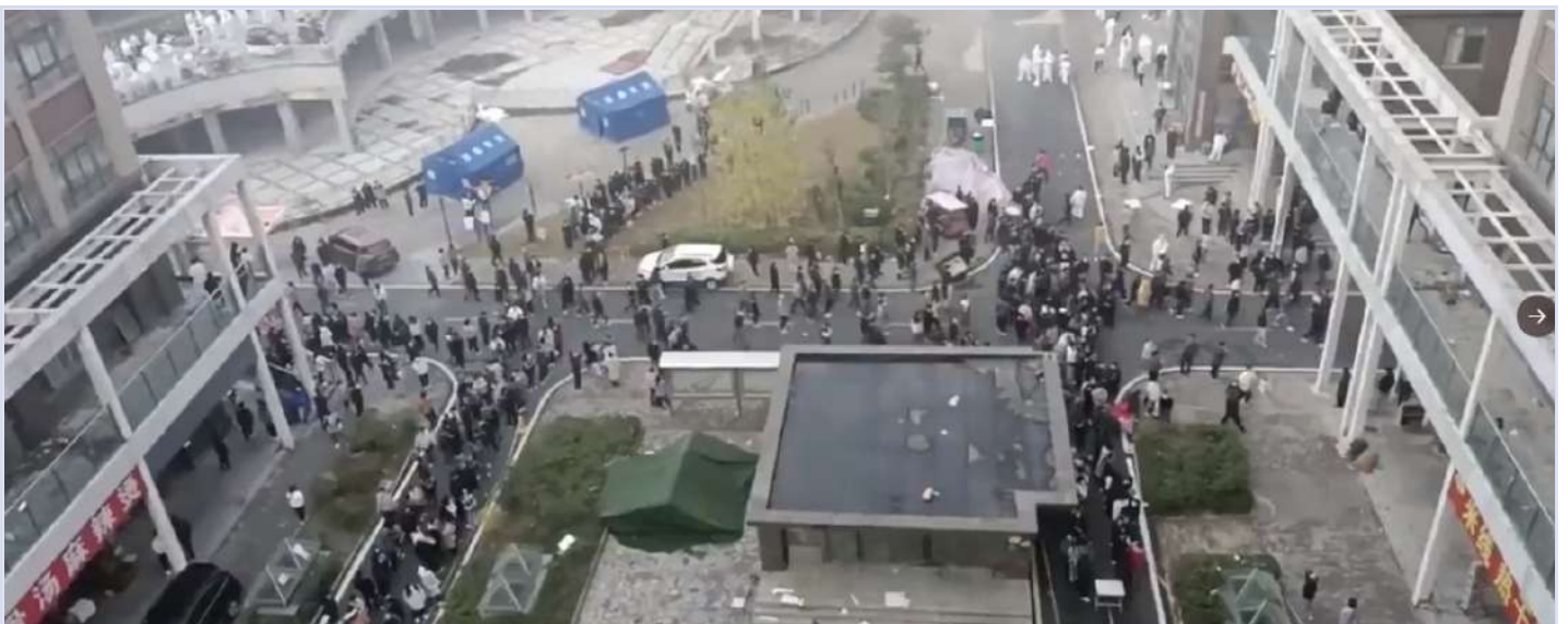
工人冲出宿舍，与身穿防护服之警察对峙（另一说为保安）

11月23日上午，郑州富士康工人因为奖金合约问题，与工厂和警察发生激烈冲突。 网络流传视频 显示，警察曾发射催泪弹、高压水枪试图驱散工人。工人抗议的原因是，富士康公司临时 更改奖金条款 ，不仅将在职时间延长至明年3月及5月，更要求工人缺勤小于60小时。这样的条款意味着工人只要被隔离即无法拿到之前宣传的奖金，在疫情扩散的情况下工厂实际上是违背承诺不愿发放奖金。