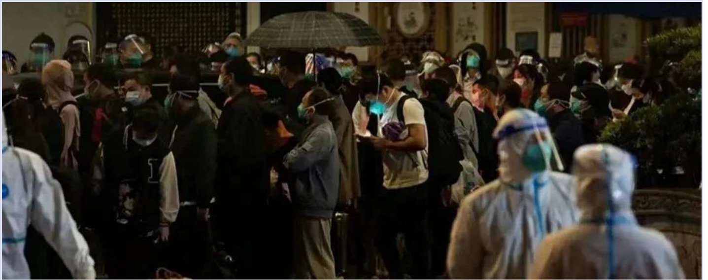
11月4日，鹭江社区排队等待转运的市民

康鹭，广州的城中村，是5200多家厂商的集中地。超过30万制衣行业从业者在此谋生。疫情中几万居民被转运，有人被封控达20余天，另有人流落街头。一位滞留人员讲述，他的码变红码被要求居家隔离后，村委不让回家。居委、指挥部之间互相推诿，他被迫露宿，在变成绿码后仍被拒之门外。本文追溯了康鹭区普通人的经历，并收录了帮助他们的渠道。 阅读原文