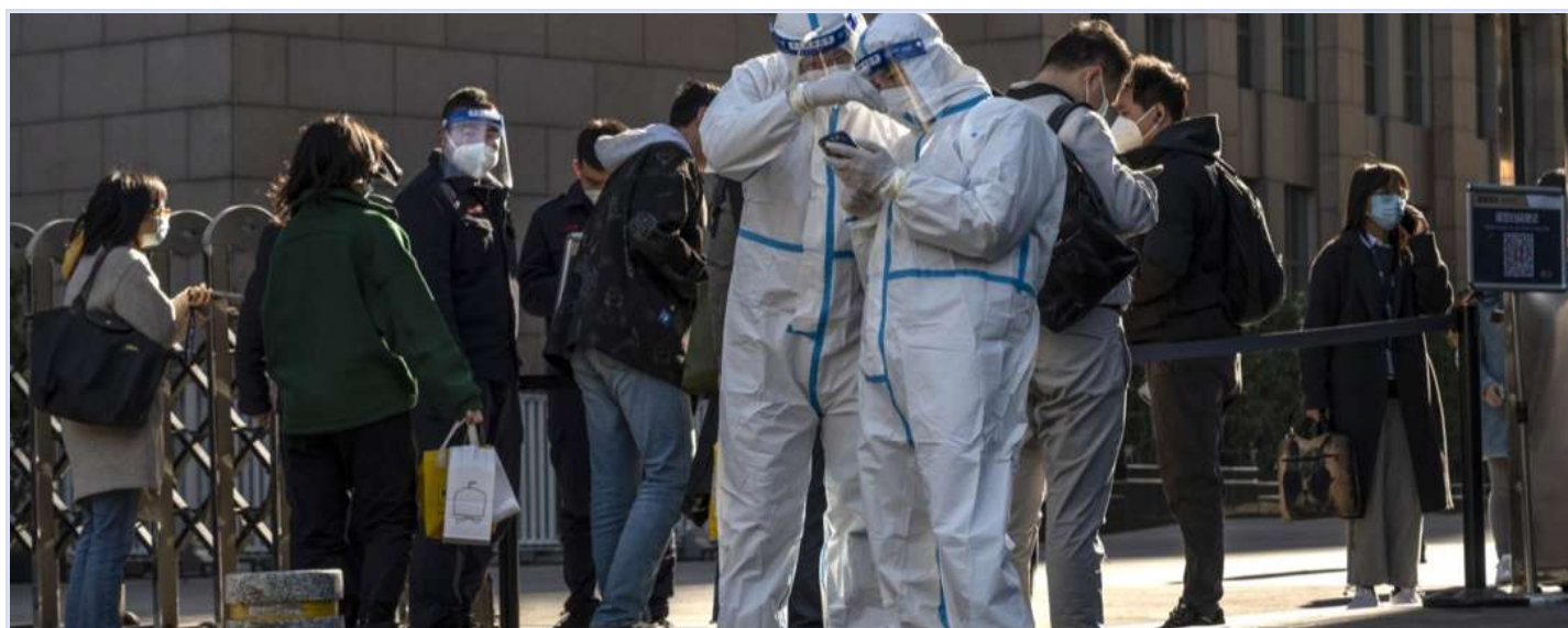
北京，员工轮流扫码进入大楼工作

从2020年开始，防疫政策不仅将人封锁家中，也把人堵在家外。有人因为二十大前航班频频被取消，被弹窗困里三个月，尝试用国际版健康码后依然被退回，在其广州封城前一天突破回到家；有人出差上海尝试回京后被弹窗封锁，驱车前往河北唐山“洗码”，在高速检查路上和警察、