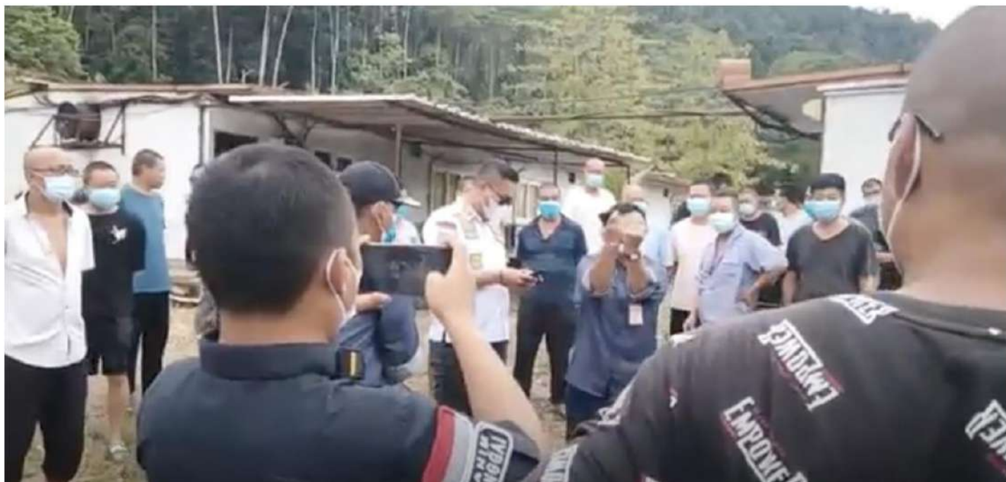
印尼当地的官员举起双手，示意工人抗议会被逮捕。

而如果选择向中国大使馆或商务局机构寻求协助，工人们虽然偶有成功记录，但大部分投诉仍然被驳回（因为工人没有合同，或合同被公司扣留）。于是， 本身就处在弱势地位的劳工群体 ，一方面容易被当地“公共”体系判定为犯罪者，另一方面又被中国机构所无视，陷入孤立无援的境地。