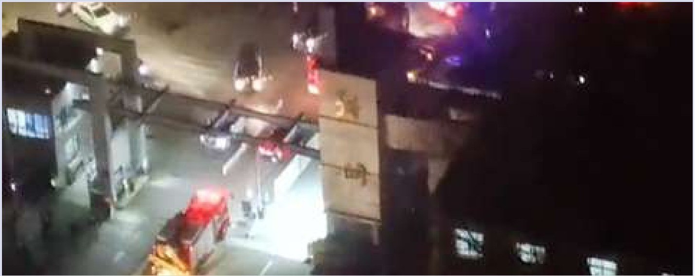
多辆消防救护车主动，但未能拯救被困工人

12月1日，鞍钢众元产业公司金属结构公司脱硫塔塔斗脱落，致8人被脱硫灰埋压。12月5日深夜，8名工人均已遇难。今年以来全国各地发生了多起脱硫塔事故，已造成20人以上的伤亡。 3月的包钢事故以来 ，项目委托方和承包方安全保障不到位，监管缺位等种种弊病被多次指出，依然未得到解决。企业缺乏系统安全管理造成的惨痛的事故却要让工人用性命来买单。 阅读原文