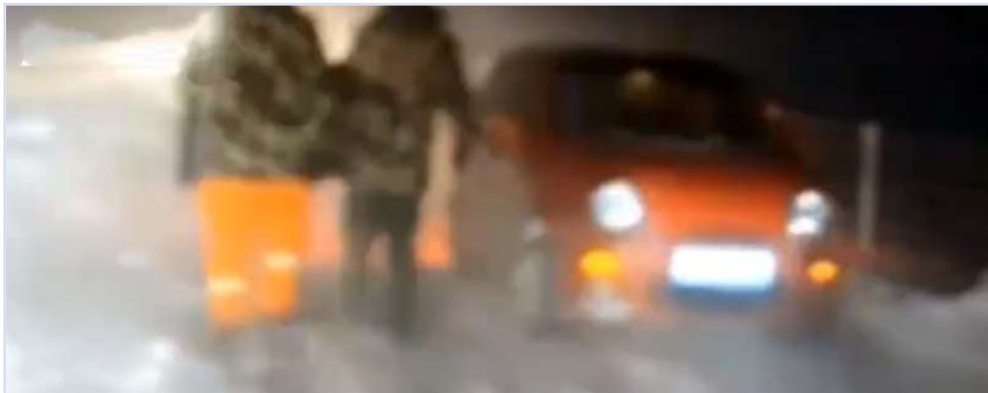
网传工人停工返乡截图

本文报道了惨剧背后的“离疆边缘人”。自新疆封控以来，有大量外来务工人员被迫滞留。除了专列、包机，运送滞留人员返乡的方式极少，在山区、戈壁等野外的外来务工者，一直在离疆途中被置于边缘。在物资匮乏的地区，封控期的生活异常难熬。因必须由社区批准才能离开的限制，许多工人连申请的渠道都没有。 阅读原文