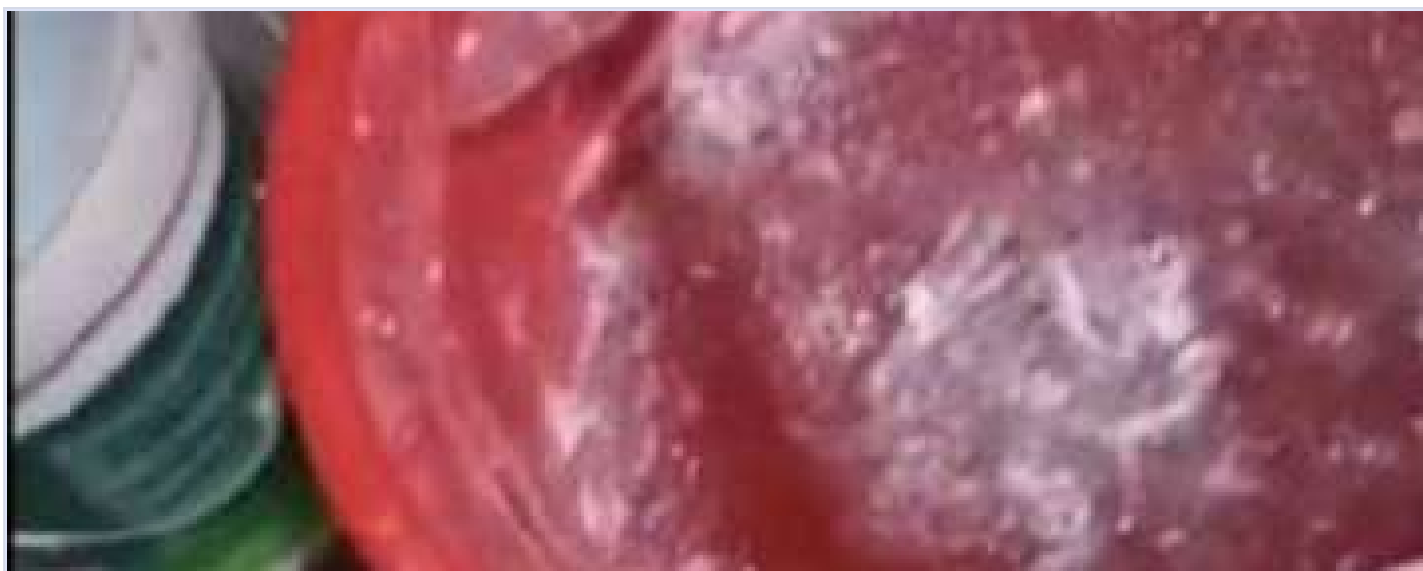
工人用水都是结冰的

11月20日以来，新疆阿勒泰地区遭受近10年以来最强区域性寒潮天气。11月26日，8名公路建筑工人在返回场站途中遭遇暴风雪， 7人不幸遇难 。同时，在如此恶劣天气下，多地工地实行隔离却无法保障外来务工人员基本生活，有 网友发文求救 称，“新疆现在零下30多度，他们没有任何取暖设施，食物只有仅有的白菜土豆维持，用水都是结冰的...新疆没有任何的人管他们，不让出，不让进”。