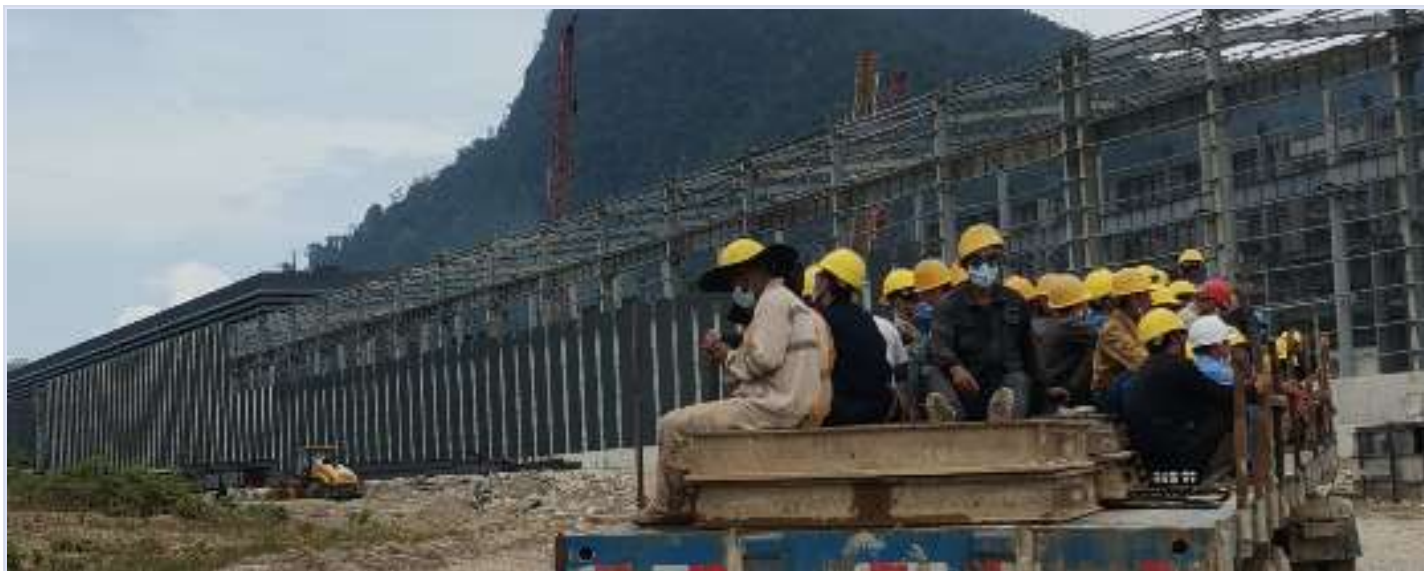
工地上的中国工人

利的保障没有改善，如果国内对于劳务中介和海外用工渠道的监管不加强，那未来我们所搭建的一切桥梁，隧道，铁路，只会把越来越多工人送向欺压，死亡，与奴役。