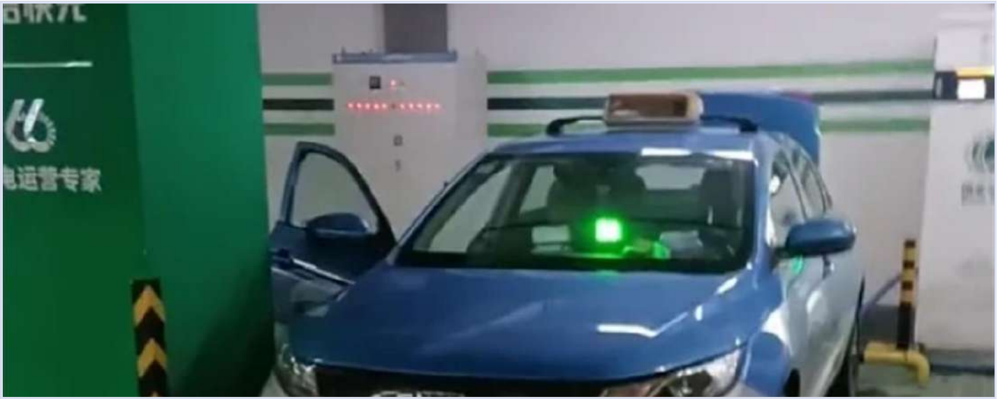
去世司机所开车辆

12月3日中午，杭州上城区一家居广场的地下停车场内，一辆新能源出租车在充电时，司机在车内失去了意识。被同行发现时，疑似已经猝死。有司机留言提到“18小时不稀奇，累了去机场排队打个盹，洗澡去公共厕所。”“我早上6点半出车，11点回来，真心累”。这些超时劳动背后是公司或网络平台多跑多拿的简单规则，并未考虑休息与身体限制。 阅读原文