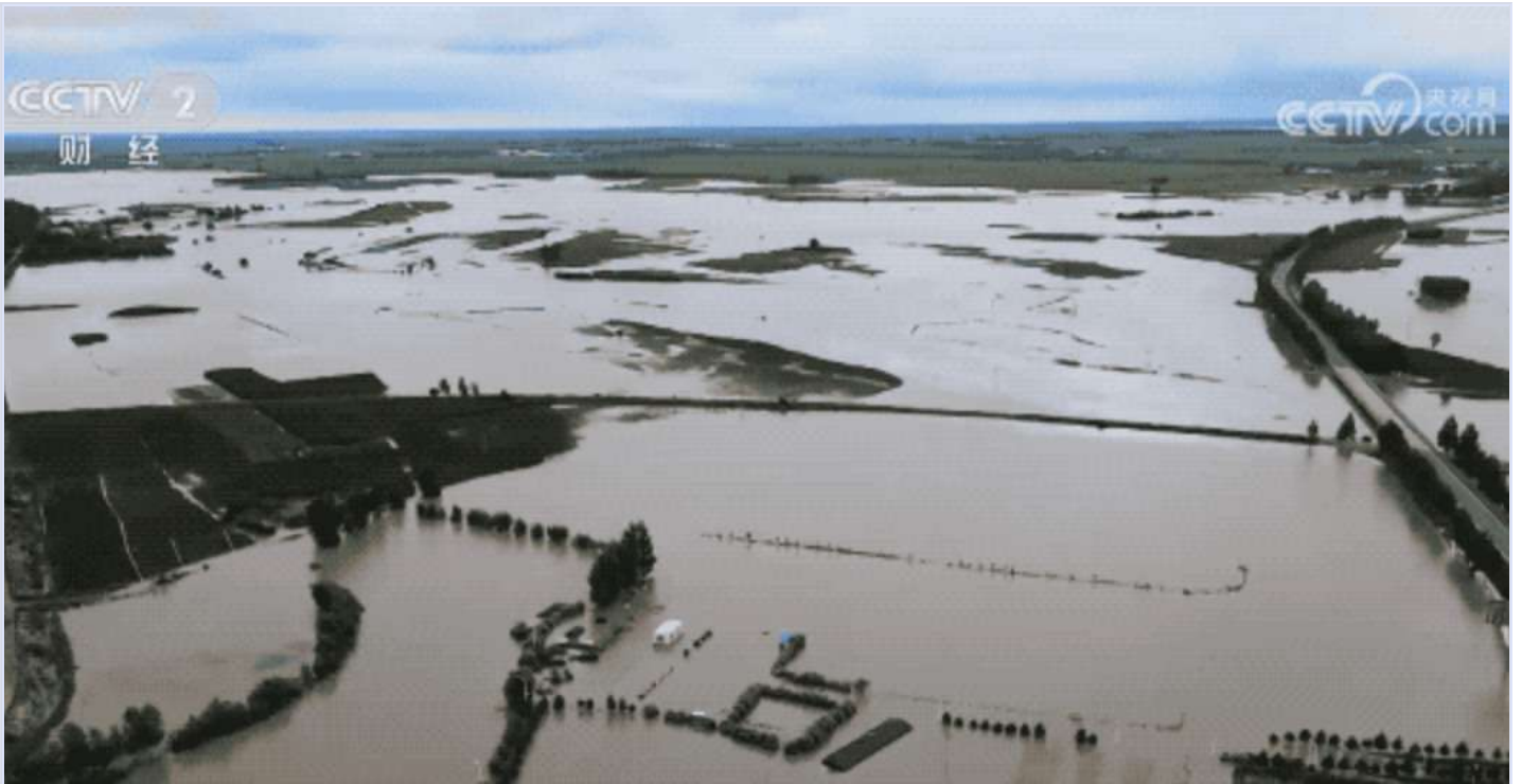
黑龙江五常被淹农田

养殖户面临的问题恐怕更严重，此次受淹的涿州也是重要养猪基地。村民在洪水时撤离至少一周时间。这段时间内即使猪能够顽强活下来，未被洪水淹死或冲走，也会因饥饿而变得极度虚弱，更严重的是，许多猪在洪水中会感染疫病（ 来源 ）。即使勉强活下来，这些猪也维持不了太久。养猪户的投入比种植往往要更高上许多，不仅是因为猪只更昂贵，也因为猪圈的各种设备、房屋都需要长期的投入。洪水让许多养殖户损失上百万元。